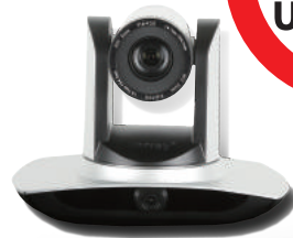
Full HD 강사자동 추적 카메라 (UV100)

H.264, 1920×1080 Full HD 영상 PC, 모바일 기기 등 사용자의 기기에 상관없이 최적의 영상 재생